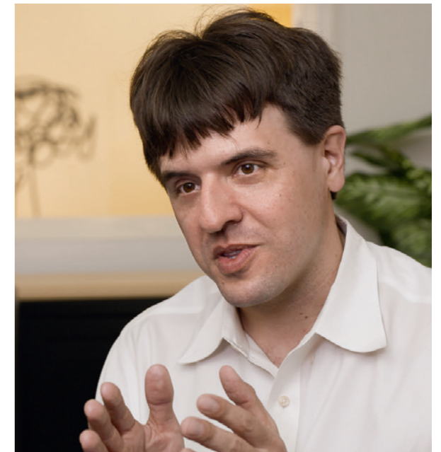
Für Karl Deisseroth ist das Verständnis neuronaler Netzwerke die Grundlage zukünftiger Therapien.

Ich verschreibe Medikamente und wende Techniken aus der kognitiven Verhaltenstherapie an. Bei einigen Patienten ver-